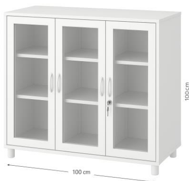
Zdjęcie poglądowe z Internetu