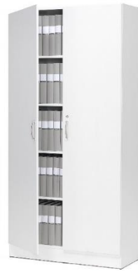
Zdjęcie poglądowe z Internetu