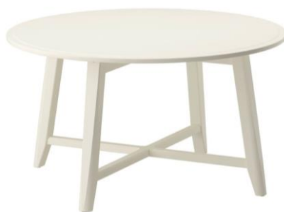
Zdjęcie poglądowe z Internetu