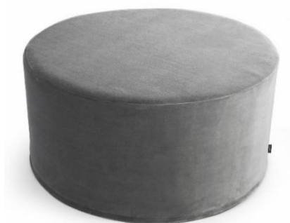
Zdjęcie poglądowe z Internetu