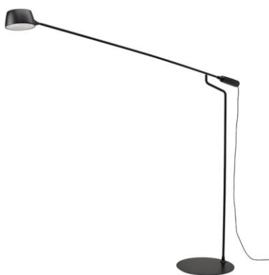
Zdjęcie poglądowe z Internetu