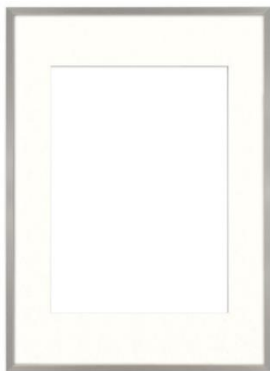
Zdjęcie poglądowe z Internetu