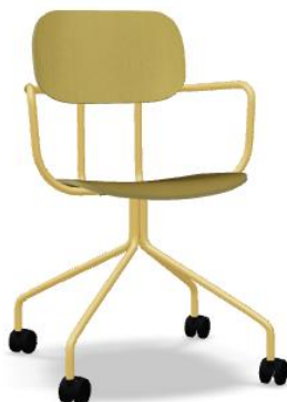
Zdjęcie poglądowe z Internetu