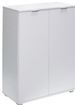
Zdjęcie poglądowe z Internetu